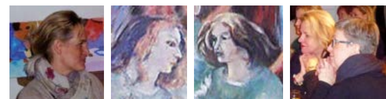
Bilder: Apsisfresko, Konfirmandinnen der Erlöserkirche von 1901